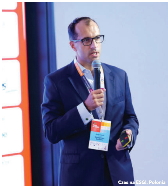
Czas na ESG!, Polonia

A apresentação da Management Solutions analisou a proposta da Lei Europeia de Inteligência Artificial e suas implicações para o setor bancário, com foco especial nas obrigações para modelos de IA de alto risco.