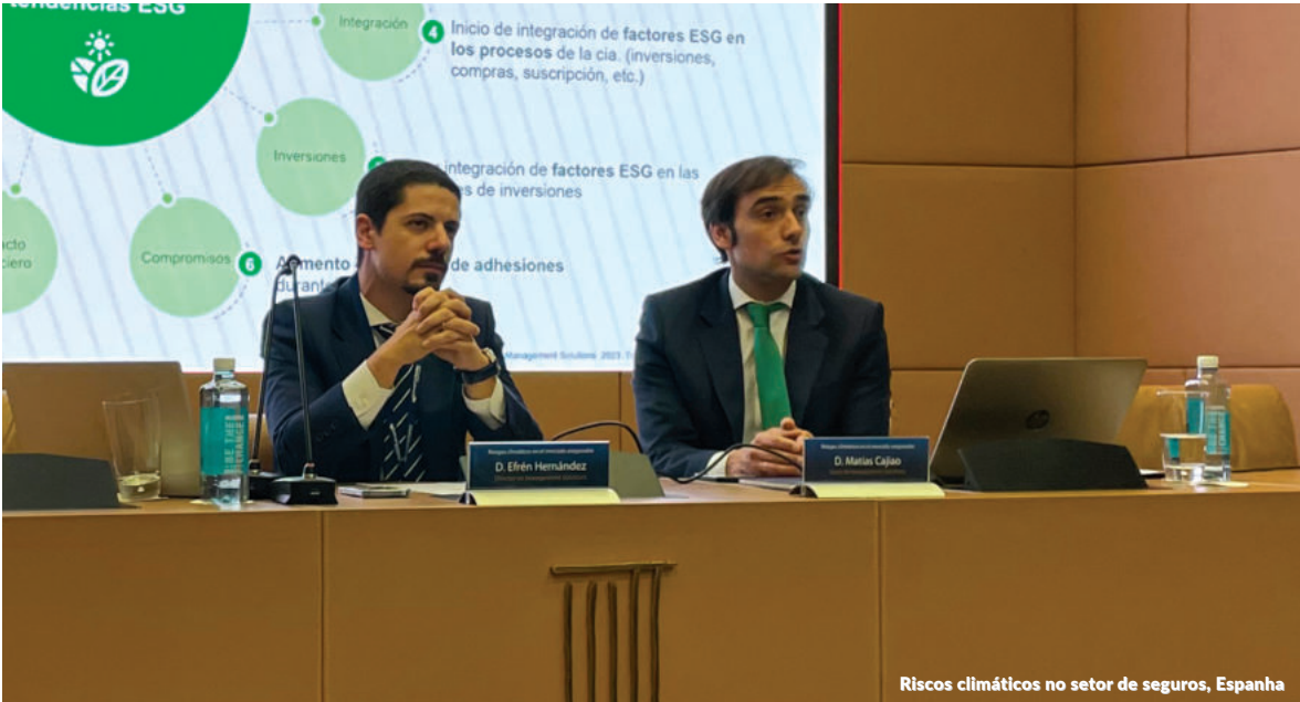
Riscos climáticos no setor de seguros, Espanha

O evento abordou aspectos relevantes, como o cenário regulatório da inteligência artificial, as implicações práticas para os bancos, os avanços na modelagem, validação e gerenciamento de modelos e o auto machine learning, entre outros.