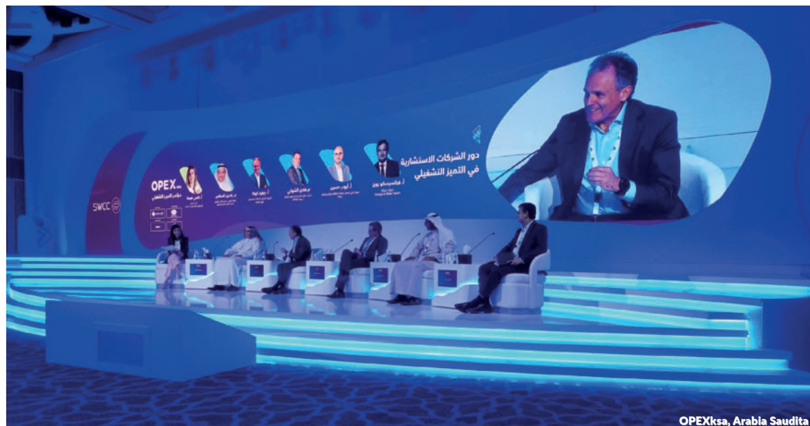
OPEXsa, Arabia Saudita