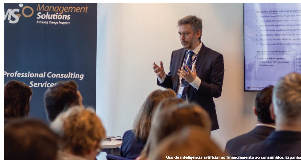
Uso de inteligência artificial no financiamento ao consumidor, Espanha

Durante o evento, que contou com a presença dos principais responsáveis pelo Departamento de Gestão Regulatória da SBS, foi apresentada uma visão geral do atual cenário macroeconômico e das prioridades regulatórias em riscos, tanto na Europa como na América Latina e no Peru. A apresentação da Firma permitiu uma análise aprofundada das principais tendências do setor em risco de crédito, modelagem e outros riscos financeiros, nos quais a Management Solutions possui um amplo conhecimento especializado.