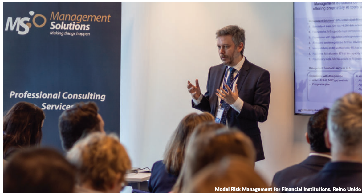
Model Risk Management for Financial Institutions, Reino Unido

Durante el evento, que contó con la participación de los principales responsables de la Gerencia de Regulación de la SBS, se realizó un repaso del escenario macro actual y de las