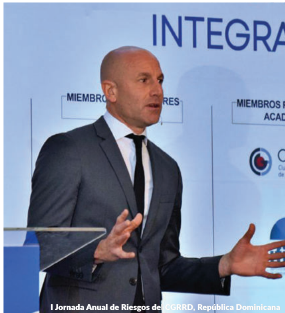
I Jornada Anual de Riesgos del CGRRD, República Dominicana

En virtud de la colaboración que, en el ámbito de capacitación en riesgos climáticos mantienen ambas entidades, la Corporación Financiera Internacional (IFC, por sus siglas en inglés), miembro del Grupo del Banco Mundial, a través de su IFC-Green Banking Academy, y Management Solutions, impartieron el curso Gestión de Riesgos y Oportunidades Climáticas organizado en el marco del Programa de Industrias Sostenibles de El Salvador.