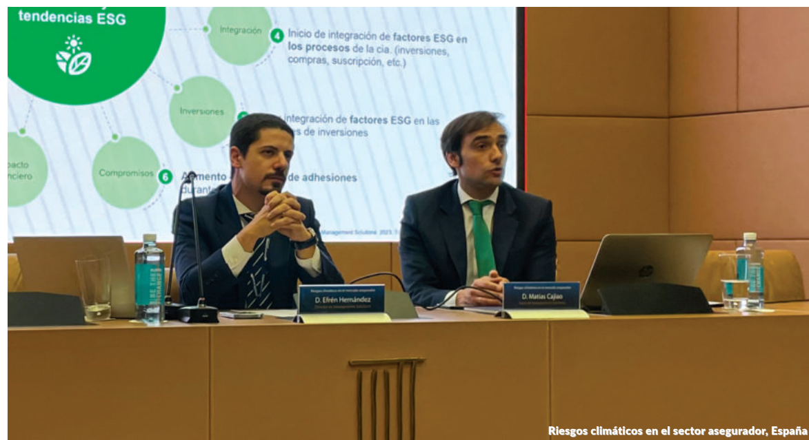
Riesgos climáticos en el sector asegurador, España

Durante el evento se abordaron aspectos relevantes como el panorama normativo de la inteligencia artificial, las implicaciones prácticas para los bancos, los avances en la modelización, validación y gestión de modelos, y auto machine learning, entre otros.