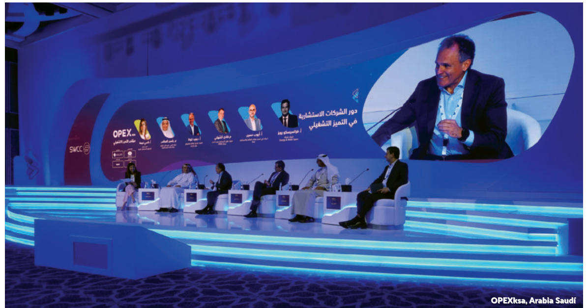
OPEXksa, Arabia Saudi