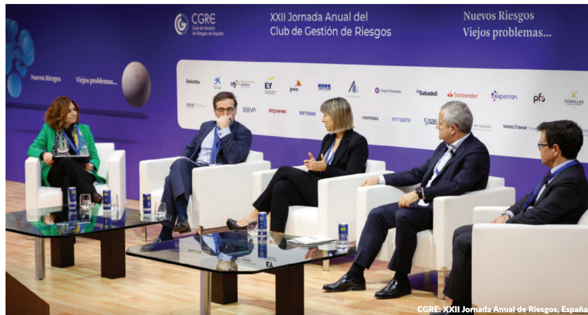
CGRE: XXII Jornada Anual de Riesgos, España

Además de patrocinar el evento, Management Solutions participó como ponente en el 12º Seminario Internacional de Riesgos Operacionales de la Asociación de Bancos del Perú (Asbanc), que contó con la asistencia virtual de representantes de las instituciones financieras presentes en el país.