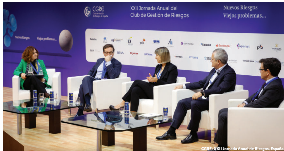
CGRE: XXII Jornada Anual de Riesgos, España

Además de patrocinar el evento, Management Solutions participó como ponente en el 12º Seminario Internacional de Riesgos Operacionales de la Asociación de Bancos del Perú (Asbanc), que contó con la asistencia virtual de representantes de las instituciones financieras presentes en el país.