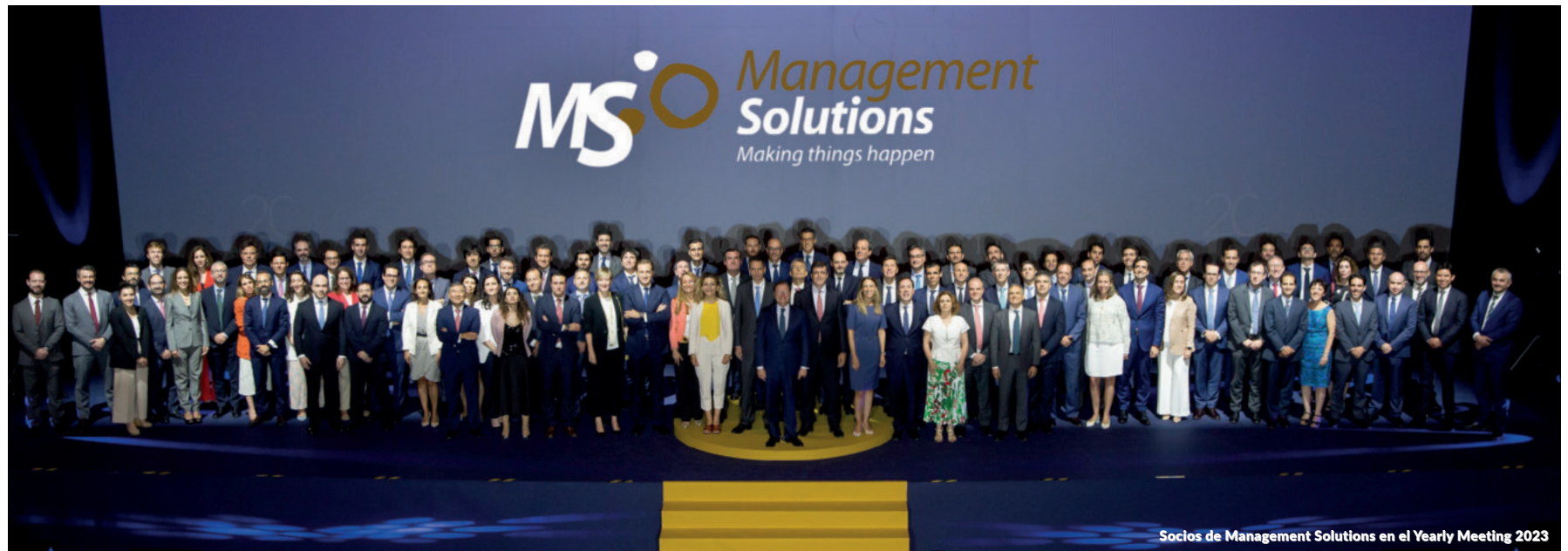
Socios de Management Solutions en el Yearly Meeting 2023

Una línea fundamental de nuestra política de responsabilidad social ha sido siempre el vínculo con la Universidad: colaboramos con más de 350 universidades mediante la firma de convenios para becas y prácticas; impartiendo másteres, clases y seminarios especializados; cooperando en programas de investigación; participando en foros de empleo; y patrocinando y apoyando a fundaciones y asociaciones universitarias.