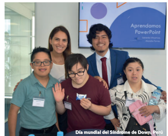
Día mundial del Síndrome de Down, Perú