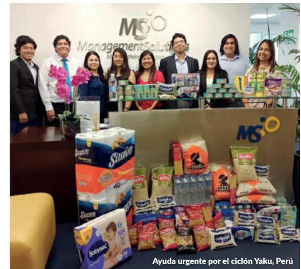
Ayuda urgente por el ciclón Yaku, Perú