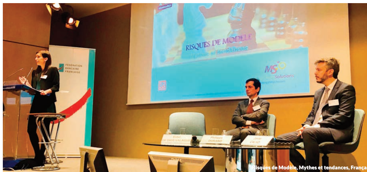
Risques de Modèle, Mythes et tendances, França