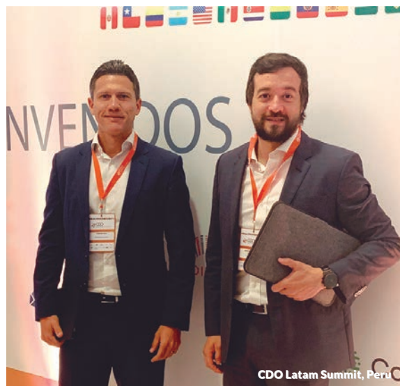
CDO Latam Summit, Peru