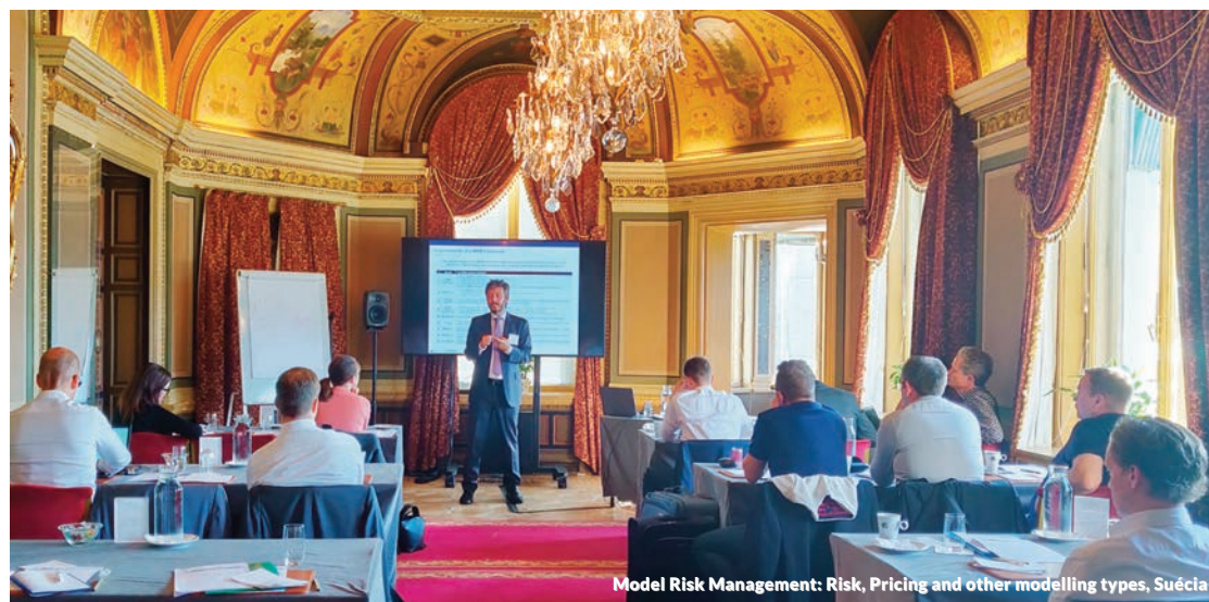
Model Risk Management: Risk, Pricing and other modelling types, Suécia

A Management Solutions participou da mesa redonda "Impactos da regulamentação da Solvência II: dos resultados atuariais à tomada de decisão", que serviu como encerramento do Congresso, e na qual os diferentes palestrantes apresentaram suas experiências sobre o papel do atuário nos