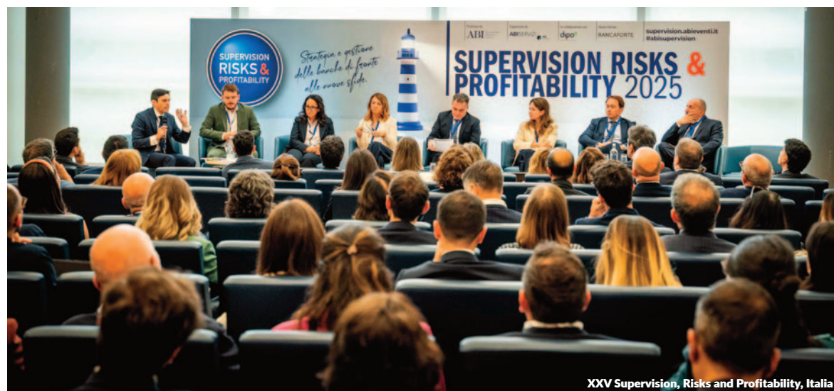
XXV Supervision, Risks and Profitability, Italia

A Management Solutions patrocinou a nova edição do Risk Minds International, um evento global de gestão de riscos realizado em Londres e focado nos desafios emergentes do setor financeiro.