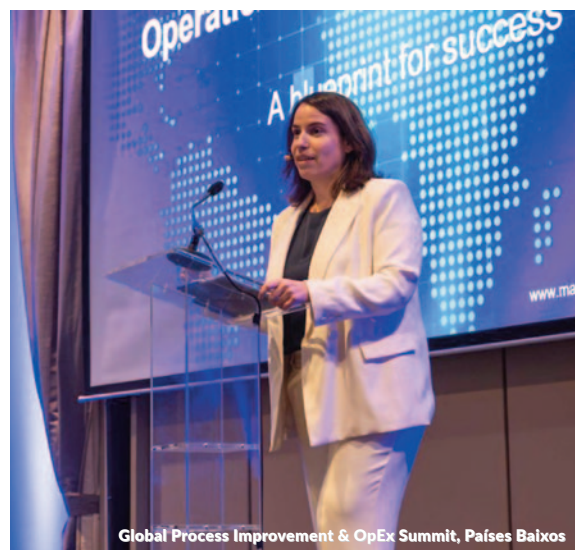
Global Process Improvement & OpEx Summit, Países Baixos

Global Process Improvement & Operational Excellence Summit, Países Baixos