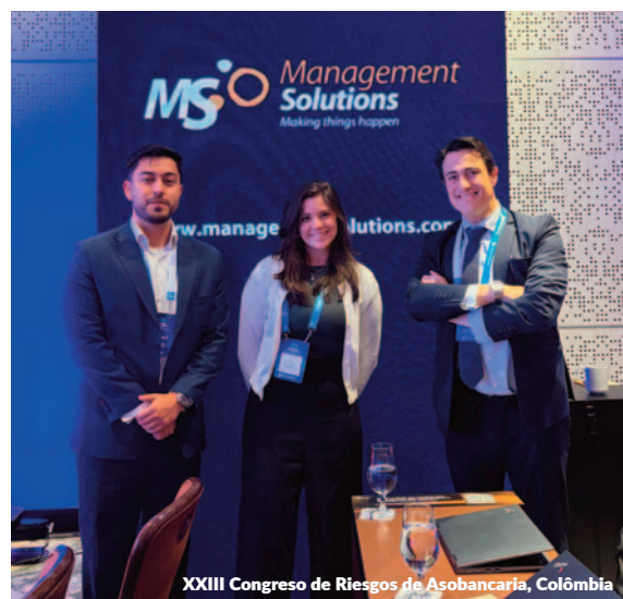
XXIII Congreso de Riesgos de Asobancaria, Colômbia

profissionais do setor financeiro colombiano e de outros países da região.