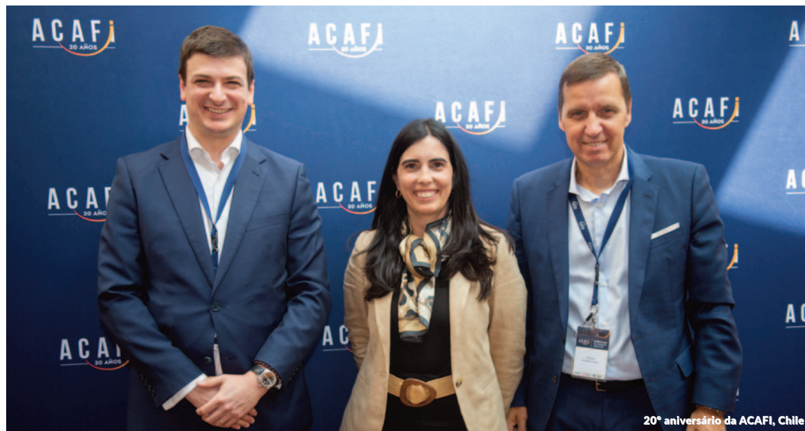
20º aniversário da ACAFI, Chile

Durante a sessão, a Firma participou do painel "Alinhando esforços de resiliência em todas as unidades de negócios para garantir operações contínuas durante crises", que destacou a importância da criação de estratégias de resposta a crises, a necessidade de uma mentalidade organizacional focada na resiliência, a realização de exercícios de crise e a importância de uma estratégia digital sólida baseada na melhoria contínua.