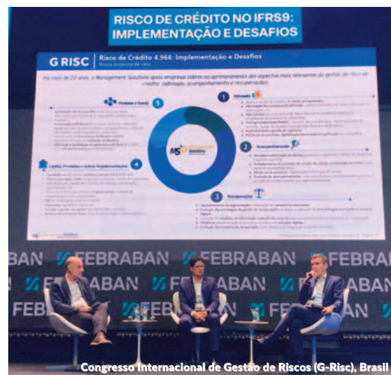
Congresso Internacional de Gestão de Riscos (G-Risc), Brasil

Durante o webinar, foram apresentados quatro casos de uso desenvolvidos com o GenMS™, a estrutura de IA generativa da Management Solutions, ilustrando como essa tecnologia pode