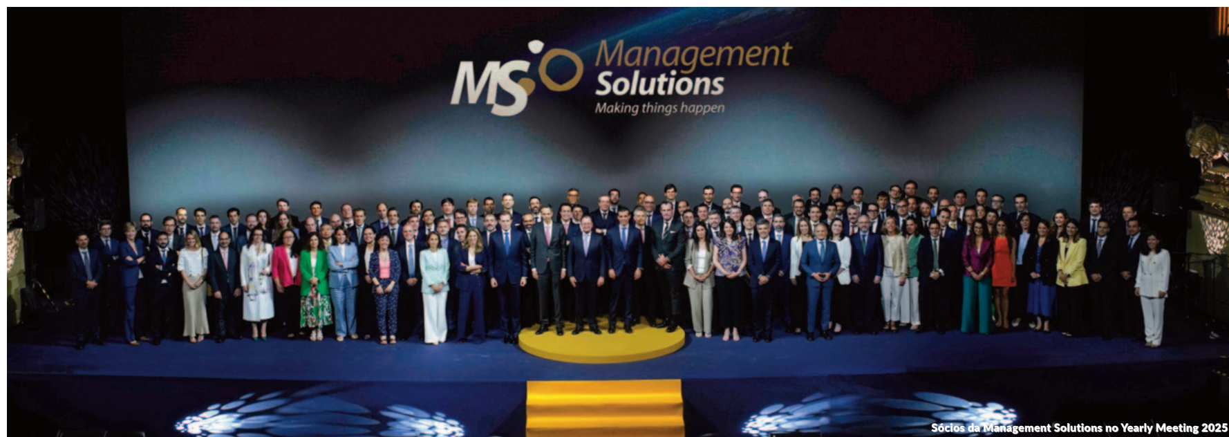
Sócios da Management Solutions no Yearly Meeting 2025

Uma linha fundamental de nossa política de responsabilidade social sempre foi o vínculo com a universidade: colaboramos com mais de 400 universidades assinando acordos para bolsas de estudo e estágios; ministrando cursos de mestrado, aulas e seminários especializados; cooperando em programas de pesquisa; participando de fóruns de emprego; e patrocinando e apoiando fundações e associações universitárias.