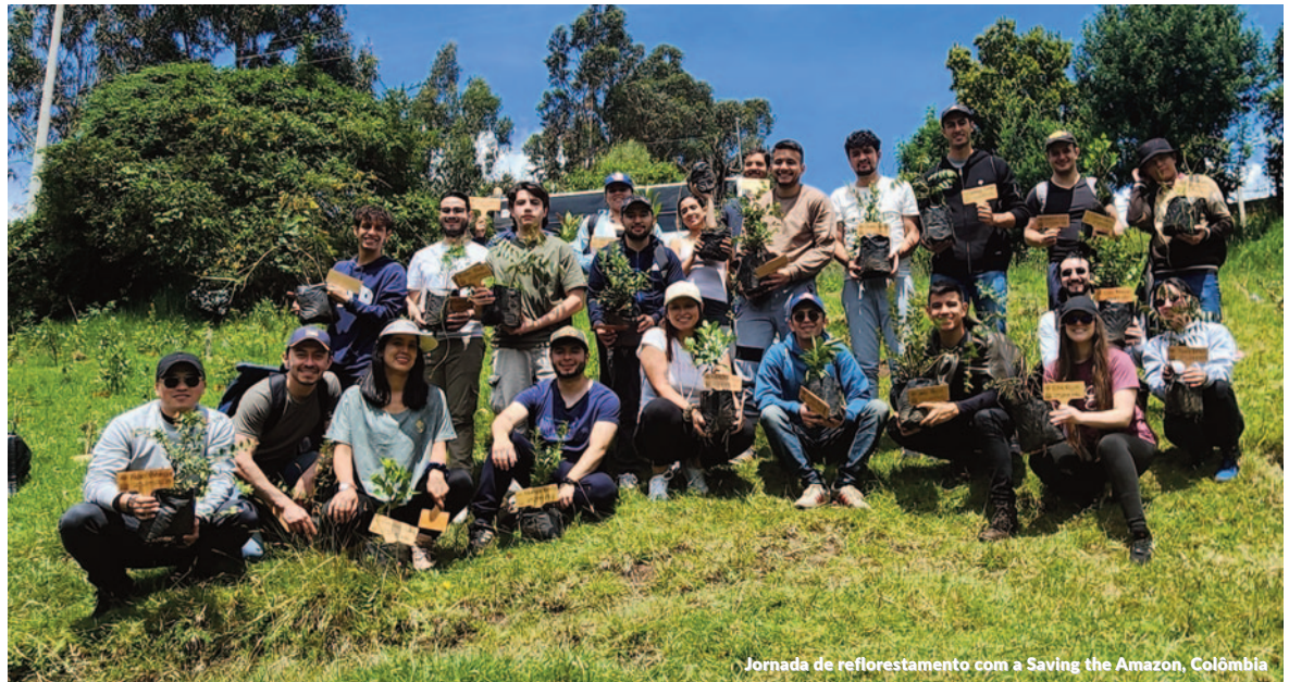
Jornada de reflorestamento com a Saving the Amazon, Colômbia