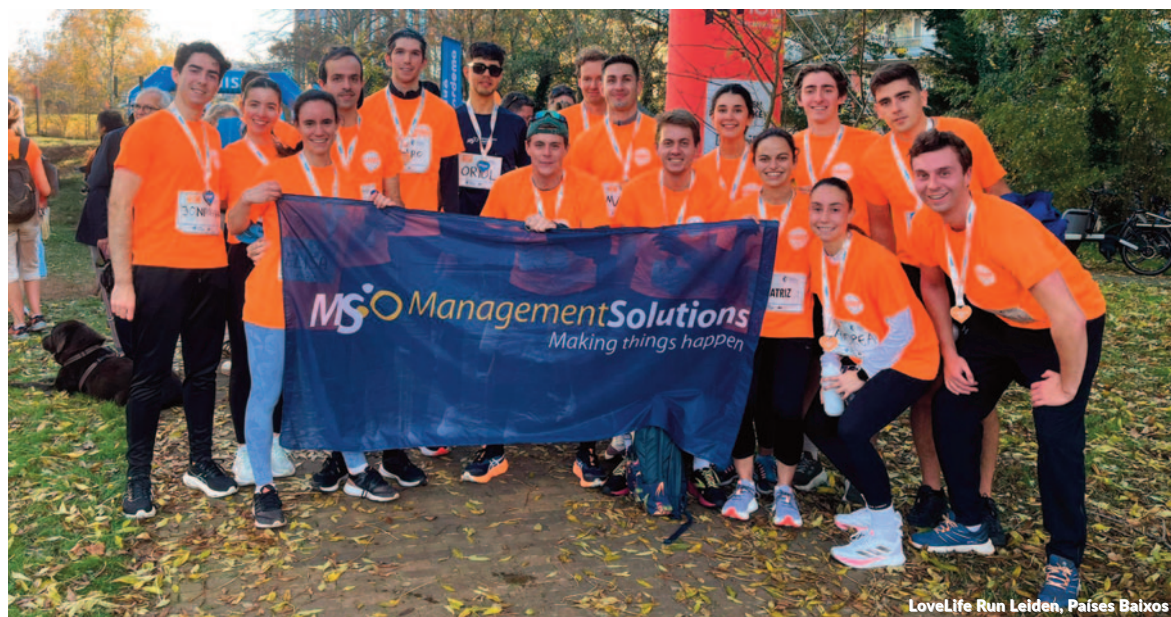
LoveLife Run Leiden, Países Baixos

para apoiar crianças com distúrbios neurológicos e suas famílias, ambos na Espanha; "Cancer Research UK London Winter Run" no Reino Unido; corrida "Sempre Mulher" em Portugal, em apoio a mulheres com câncer de mama; LoveLife Run Leiden, organizada pela Fight Cancer, na Holanda, para apoiar a pesquisa sobre o câncer; Carrera Kardias, na Cidade do México, para arrecadar fundos para cirurgias cardíacas em crianças com doenças cardíacas; e o 16 th Annual TC Golf Outing, para arrecadar fundos para a pesquisa sobre o câncer nos Estados Unidos.