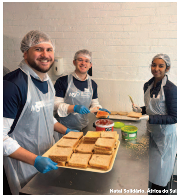
Natal Solidário, África do Sul