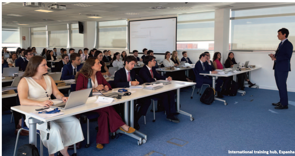
International training hub, Espanha

Além disso, como sinal de seu compromisso com o mundo da cultura e das artes cênicas, a Firma é patrono do Royal Theatre e Grande Amigo do Royal Theatre, em virtude da contribuição que a Firma e seus profissionais fazem à Fundação Amigos do Royal Theatre. Além disso, a Management Solutions patrocinou a "IV Gala Espanhola", realizada em Nova York, e a estreia da Orquestra Principal do Royal Theatre em Pequim, tudo isso com o objetivo de promover a música e a cultura espanhola em nível mundial.