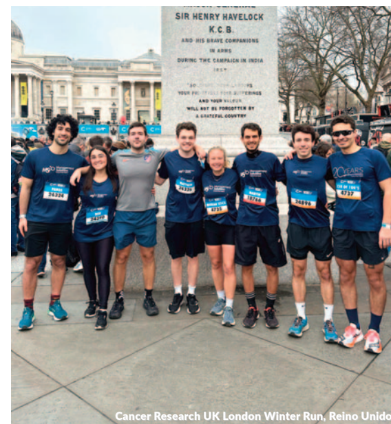
Cancer Research UK London Winter Run, Reino Unido