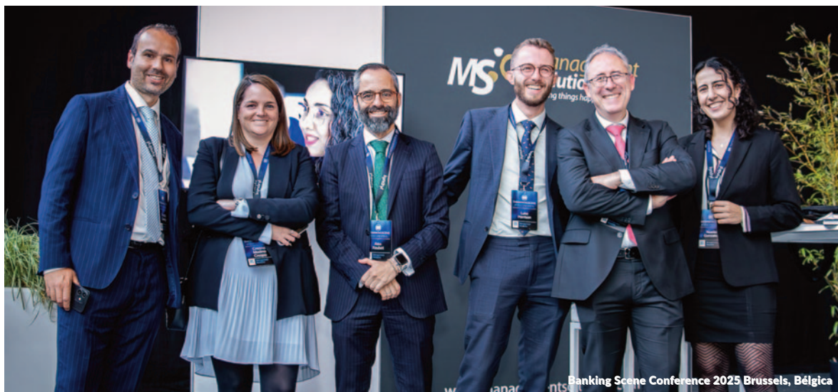
Banking Scene Conference 2025 Brussels, Bélgica

Credit Risk Management, Modelling & Validation EMEA, Países Bajos Además de patrocinar el evento, Management Solutions participó en la conferencia Credit Risk Management, Modelling and Validation EMEA, organizada en Ámsterdam, donde profesionales del sector financiero abordaron los desafíos actuales en modelización de riesgo de crédito, validación de modelos y cumplimiento regulatorio.