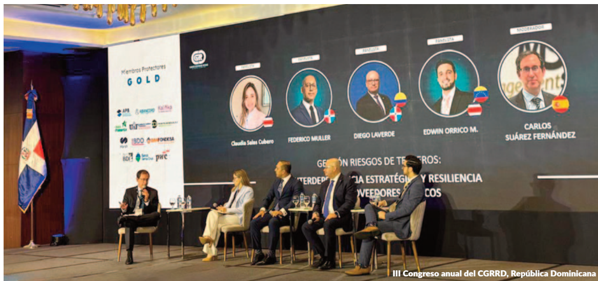
III Congreso anual del CGRRD, República Dominicana

La convención reunió a profesionales del ámbito financiero para debatir sobre cuestiones clave como el impacto de la incertidumbre geopolítica y la volatilidad en las tendencias económicas, la gestión de la liquidez y del balance, así como la evolución de los marcos regulatorios y de las tecnologías emergentes. En el bloque dedicado a Tesorería y Gestión del Balance, Management Solutions moderó diversos paneles centrados en estrategias corporativas para la gestión de la liquidez y la preparación ante situaciones de estrés de liquidez.