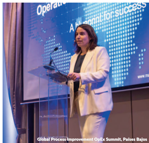
Global Process Improvement OpEx Summit, Países Bajos

Global Process Improvement Operational & Excellence Summit, Países Bajos