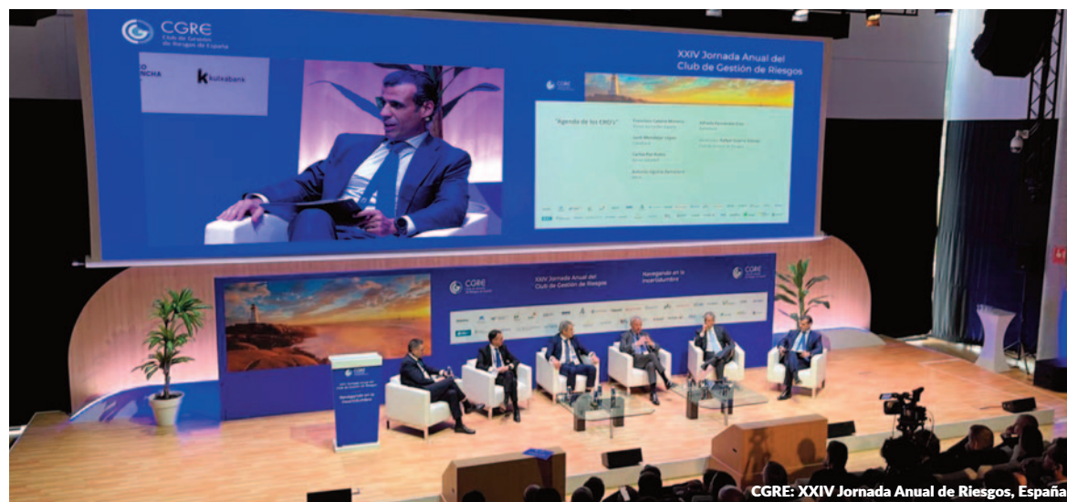
CGRE: XXIV Jornada Anual de Riesgos, España

Management Solutions participó como ponente en la 1ª Conferencia sobre Tecnología Financiera, organizada por