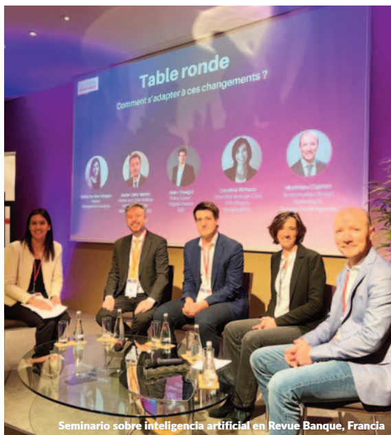
Seminario sobre inteligencia artificial en Revue Banque, Francia

El encuentro abordó la formulación eficaz de prompts y la aplicación de la IA en tareas habituales como la redacción de correos o la elaboración de informes. También se mostraron ejemplos prácticos con soluciones como Gemini, NotebookLM y Workspace Copilots. La jornada incluyó además una reflexión sobre aspectos clave relacionados con la seguridad de los datos, la privacidad y los desafíos éticos en la adopción de la IA.