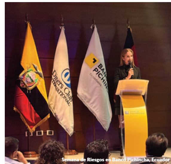
Semana de Riesgos en Banco Pichincha, Ecuador

La participación de la Firma fue doble: por un lado, presentó una ponencia sobre las tendencias en la gestión de riesgos de terceros y los retos que este tipo de riesgo plantea para garantizar la continuidad del negocio; y, por otro, moderó el panel "Gestión de