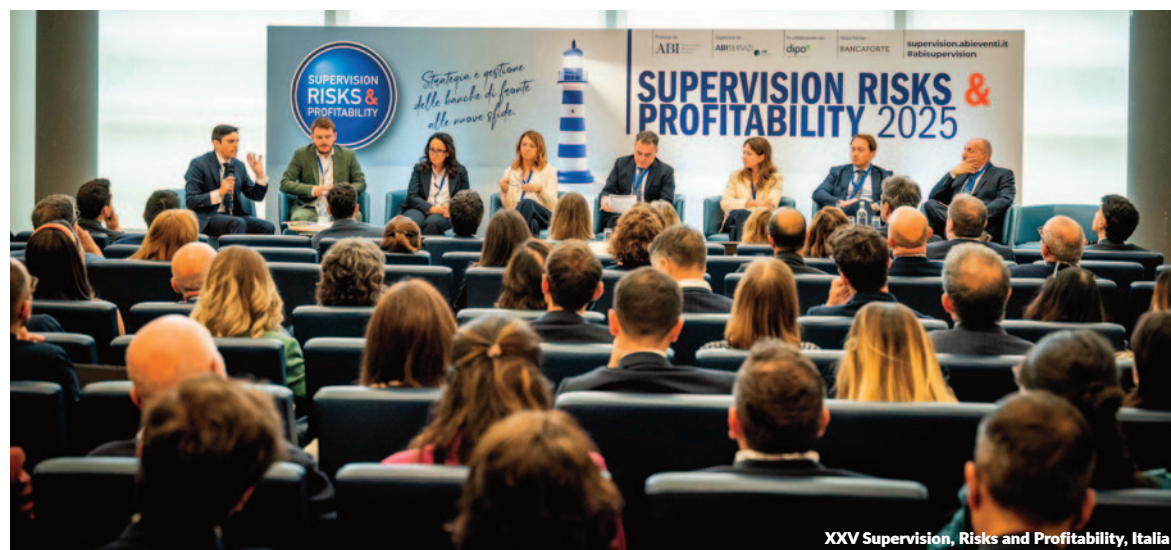
XXV Supervision, Risks and Profitability, Italia

Management Solutions patrocinó la nueva edición de Risk Minds International, un evento global sobre gestión de riesgos, celebrado en Londres y centrado en los desafíos emergentes