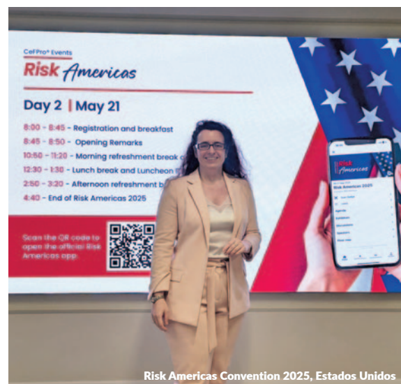
Risk Americas Convention 2025, Estados Unidos