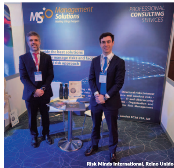
Risk Minds International, Reino Unido

Management Solutions participó como ponente en la convención Model Risk Management for Financial Institutions, celebrada en Frankfurt con el objetivo de ayudar a las instituciones financieras a superar los nuevos retos que plantea el riesgo de modelo.