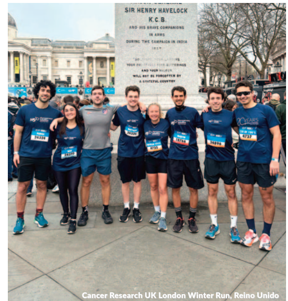
Cancer Research UK London Winter Run, Reino Unido