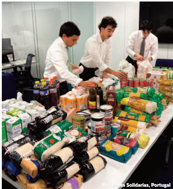
Navidades Solidarias, Portugal