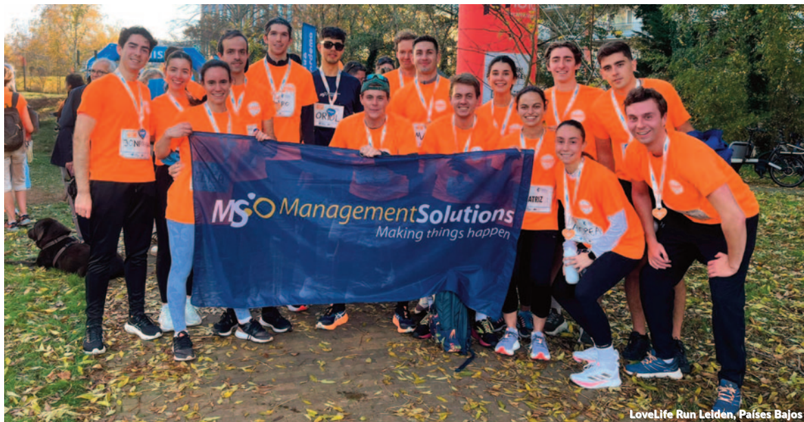
LoveLife Run Leiden, Países Bajos

de apoyo a mujeres con cáncer de mama; carrera LoveLife Run Leiden, organizada por Fight Cancer en Países Bajos con el objetivo de apoyar la investigación oncológica; Carrera Kardias, organizada con el objetivo de recaudar fondos para realizar cirugías de corazón a niños con enfermedades cardíacas, y Carrera ANSeR (Aquí Nadie Se Rinde), en favor de niños y adolescentes con cáncer, ambas en Ciudad de México; y el torneo 16th Annual TC Golf Outing para recaudar fondos para la investigación contra el cáncer, en Estados Unidos.