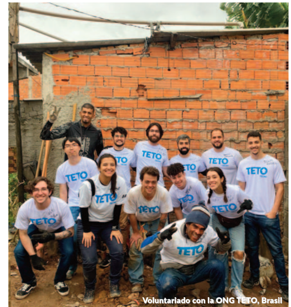
Voluntariado con la ONG TETO, Brasil